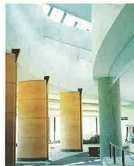
<栃木県/佐野> ヴェルディ佐野カントリークラブハウス棟