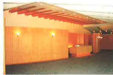
<栃木県/那須> 那須もふり湖カントリークラブハウス棟