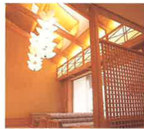
<岩手県/盛岡> ホテル森の風 (けんじワールド)