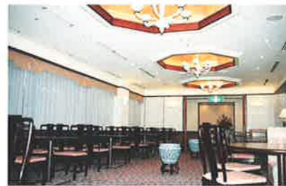
<千葉県/成田> 成田東急イン