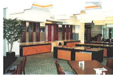
<栃木県/鬼怒川> 東急ハーベストリゾートホテル