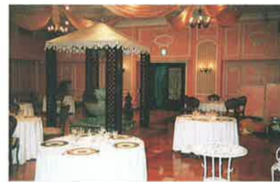
<東京都/八王子> 日本閣

堅牢さと優美さの最適調和。三建プロジェクト独自の高度な品質基準が上質な空間を演出します。